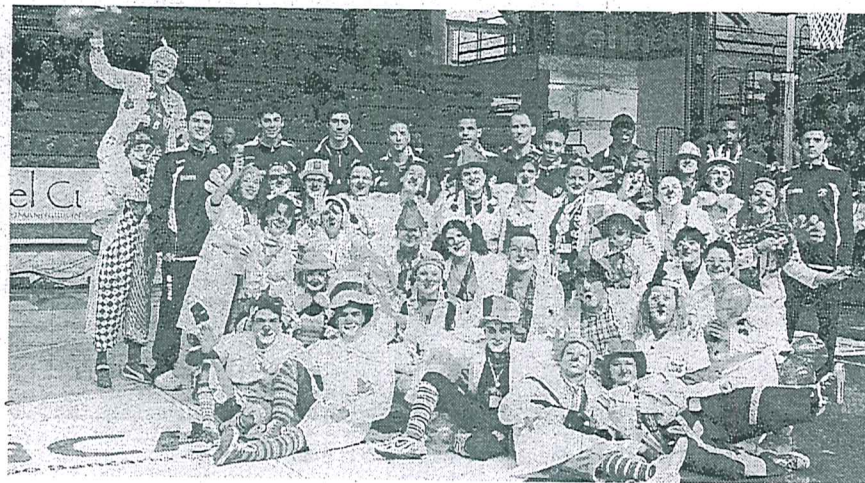
I clown di Vola nel cuore con i giocatori della Carife Basket